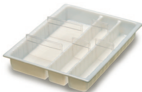
Schubladen-Einsatz mit 3 Reihen und 11 Teilern