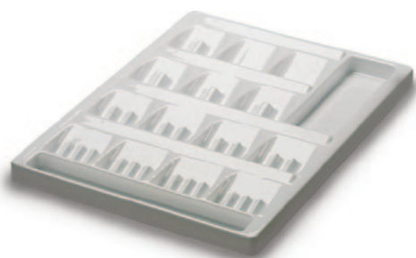
Schubladen-Einsatz für Ampullen