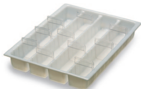
Schubladen-Einsatz mit 4 Reihen und 16 Teilern