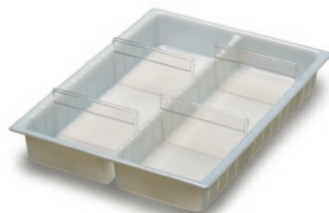
Schubladen-Einsatz mit 2 Reihen und 6 Teilern