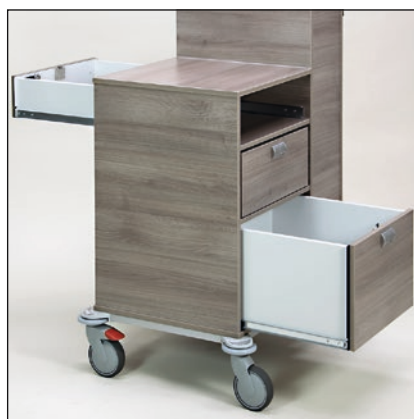
Optional können die Schubladen auch nach beiden Seiten geöffnet werden.