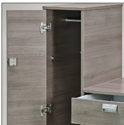
Ausgestattet mit einer praktischen Kleiderstange für lange Kleidungsstücke.

So können sich die Patienten für kürzere und auch längere Aufenthalte häuslich einrichten.