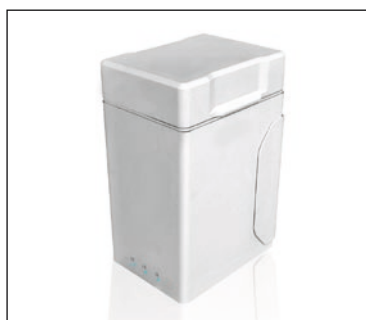
Holster für Wechselakkus