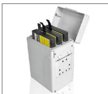
Holster inklusive Wechselakkus