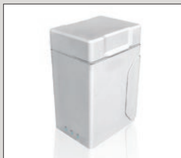
Holster für Wechselakkus