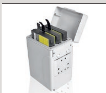
Holster inklusive Wechselakkus